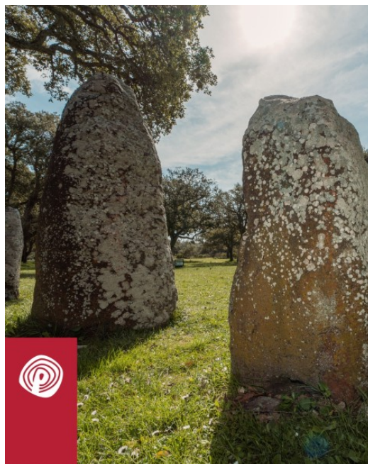
Goni, Parco archeologico di Pranu Muttedu. Menhir dell'allineamento.

Qui siamo 1500 anni prima della cultura nuragica. Possiamo vedere le prime manifestazioni epigeiche, ma passerà del tempo prima della loro effettiva affermazione. È difficile stabilire quale tomba sia più antica e quale più recente, in quanto i materiali trovati all'interno sono tutti dello stesso periodo, risalgono al 3800-3200 a.C. Le tombe più antiche di questo tipo sono state trovate per ora in Portogallo e sono datate addirittura al 6000 a.C. Sono nate nell'estremo occidente d'Europa e da lì si sono diffuse grazie al commercio dell'ossidiana. Sicuramente le tombe ipogee la parte più antica della necropoli.