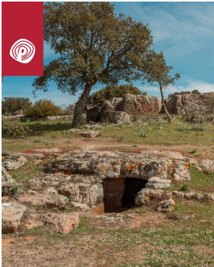
Goni, Parco archeologico di Pranu Muttedu. Ingresso di domus de janas scavata nel costone roccioso di Genna e'Accas.

La parte più antica, quella in cui si trovano le domus de janas , è datata al 4000 a.C. La necropoli è iniziata lì con i modelli tipici di domus de janas ipogeica, poi sono arrivate nuove tipologie megalitiche, ovvero monumenti che non sono scavati, ma sono costruiti con i blocchi di pietra (siamo intorno al 3200 a.C.). La necropoli è stata usata fino al 2800-2700 circa, l'epoca delle prime culture dell'età del Rame. Abbiamo delle rilevanze risalenti alla prima età del Bronzo: c'è una sorta di allée couverte , ma si trova in un terreno privato, fuori del Parco. Questo significa che tale area ha avuto un uso funerario nei millenni: è incredibile come lo stesso posto sia stato utilizzato, sempre per lo stesso motivo, da culture successive diverse.