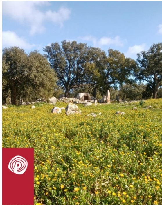
Goni, Parco archeologico di Pranu Muttedu. Tomba II in mezzo alla fioritura di calendula.

Per loro aveva un'importanza fondamentale il culto degli antenati: si intuisce dalla cura e dall'impegno impiegati nella realizzazione di questi monumenti funerari, che richiedevano un notevole sforzo organizzativo collettivo. Mentre la casa era una semplice capanna, la tomba era il luogo della memoria dove le comunità si riunivano, quindi questo santuario era importantissimo; il defunto rappresentava la memoria della comunità, per cui era di primaria importanza riconnettersi con i defunti. Sappiamo che loro credevano in una rinascita, in una rigenerazione.