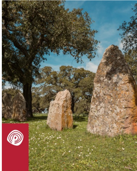
Goni, Parco archeologico di Pranu Muttedu. Menhir protoantropomorfi.