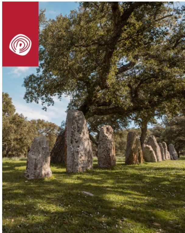
Goni, Parco archeologico di Pranu Muttedu. Allineamento di menhir protoantropomorfi.

Il nostro bellissimo parco archeologico preistorico si trova nel Gerrei, su un altopiano di circa 500 metri, all'interno di un bosco di querce da sughero alternato a pascoli. Si tratta di un'immensa area funeraria e religiosa realizzata intorno al 3000 a.C. dalle popolazioni che in Sardegna rientrano nella Cultura Neolitica di Ozieri-Sub Ozieri. L'area è stata scavata dal prof. Enrico Atzeni, docente di Paleontologia e antichità sarde, a partire dagli anni '80 del secolo scorso, e ha restituito materiali ceramici e litici interessanti. L'ultimo scavo è stato condotto sempre da Atzeni nel 2010, ma c'è ancora molto da scavare. Lungo sentieri di campagna che si inoltrano nella vegetazione si susseguono tombe ipogeiche ed epigeiche imponenti. Qui c'è la più alta concentrazione di menhir, sono circa sessanta, variamente distribuiti in coppie, allineamenti o gruppi. Sono scolpiti nell'arenaria locale e possono essere aniconici, cioè privi di raffigurazioni, lavorati finemente a martellina e per lo più del tipo proto-antropomorfo, di forma ogivale, parte frontale piatta e parte posteriore convessa.