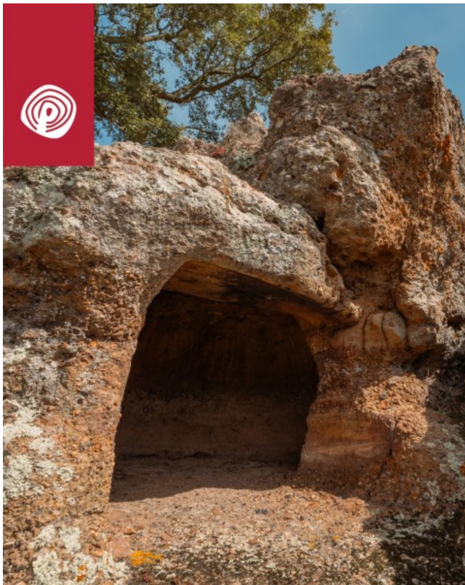
Goni, Parco archeologico di Pranu Muttedu. Domus de janas di Genna e'Accas

Su alcuni menhir è possibile identificare delle coppelle, che dobbiamo intendere come contenitore di offerte o disegno di precise costellazioni. Le piccole cavità lenticolari segnano il passaggio di qualcuno che ha voluto lasciare il suo segno sulla pietra sacra. Ancora oggi non è difficile vedere visitatori e visitatrici cercare il contatto fisico e diretto con i menhir nel tentativo di assorbirne l'energia, il potere e la fertilità in un continuum che stupisce per la persistenza e il radicamento popolare.