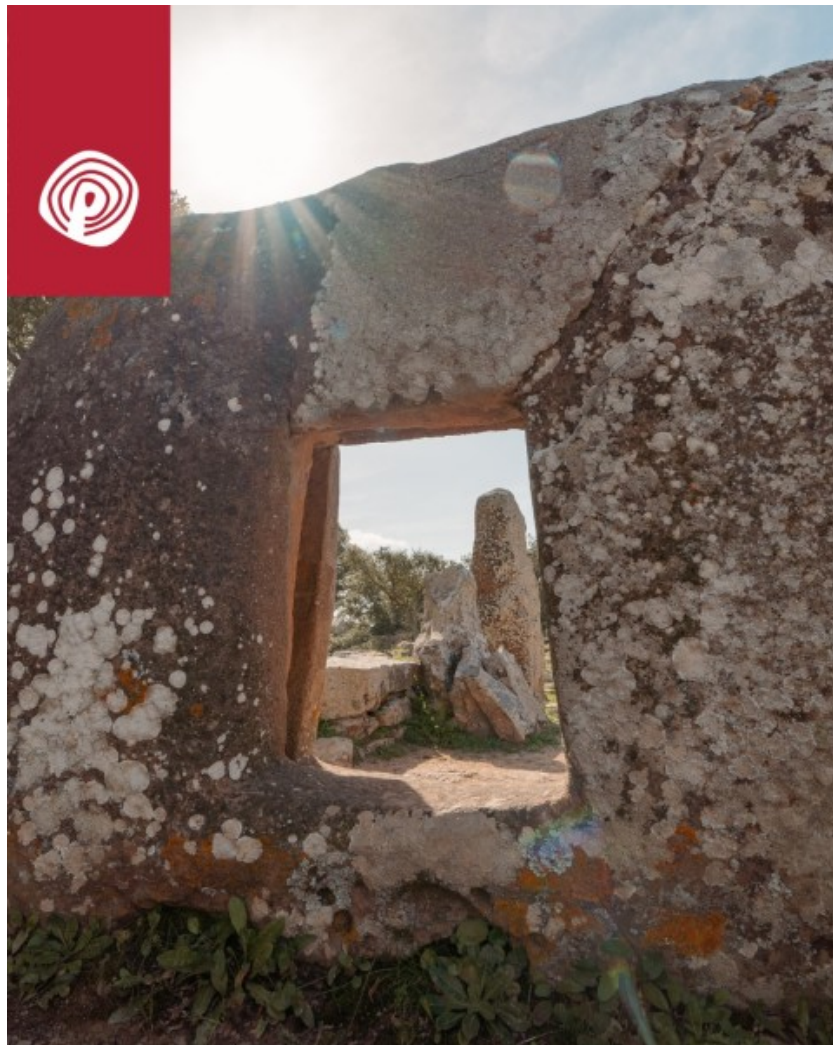
Goni, Parco archeologico di Pranu Muttedu. Porta d'ingresso della tomba II vista dall'interno.

Qui sembra di vedere le prime differenziazioni sociali, perché siamo in una fase di profondi cambiamenti all'interno delle comunità umane. Fino al neolitico le società erano abbastanza semplici, anche se si individuavano già allora ruoli sociali ben distinti, erano probabilmente società più inter pares . Con il proseguire verso l'età dei metalli si assiste, invece, ad una maggiore gerarchizzazione, per cui si notano le prime nette differenze di rango e la nascita di gruppi più importanti di altri. In particolare, emergeranno i guerrieri, che dovranno difendere le proprietà comunitarie. La gerarchizzazione si amplifica, dunque, con l'età dei metalli, quando le società si assestano e si identificano con il proprio territorio, che quindi deve essere difeso.