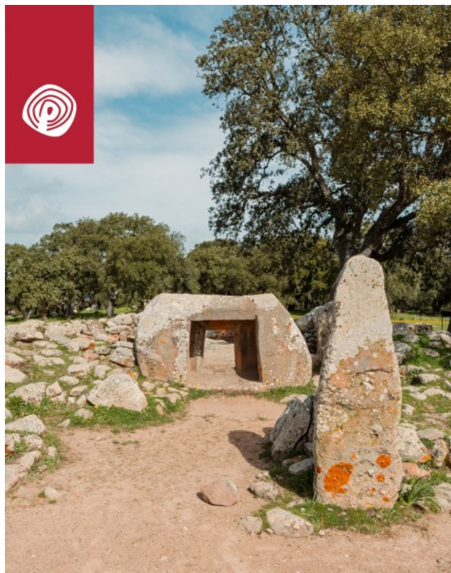
Goni, Parco archeologico di Pranu Muttedu. Ingresso della Tomba II.

La porticina scavata nella roccia è la porta d'ingresso e rappresenta il passaggio dal mondo dei vivi al mondo dei morti. Dopo la porta d'ingresso c'era una prima sala che aveva la funzione di sala delle offerte. Qui gli archeologi hanno trovato dei vasi di ceramica del tipo Ozieri con bellissime decorazioni. Le stanze funebri erano le due stanze centrali scavate dentro un monolite e le stanze laterali dotate di ingressi autonomi. Rappresenta l'anello di congiunzione tra le domus de Janas, che sono le tombe scavate nelle rocce, tipicamente ipogee, e le tombe epigee, caratterizzate dalla costruzione muraria tramite pietre squadrate sovrapposte. Questa tomba rappresenta una fase di congiunzione: nella porta e nelle stanze centrali, che sono scavate nel masso, abbiamo gli elementi della domus, ma troviamo anche la costruzione di muri con blocchi di pietra squadrata. Sicuramente era una tomba di una famiglia importante, oppure una tomba santuario, ovvero una tomba che svolgeva funzioni religiose. A favore di questa ipotesi c'è il fatto che la tomba si affaccia su una piazza circolare con al centro un accumulo di pietre. Per gli archeologi questa era una piazza cerimoniale, quindi un luogo sacro dove si svolgevano i rituali, una sorta di tempio a cielo aperto. Attorno è pieno di menhir che circondavano l'area sacra.