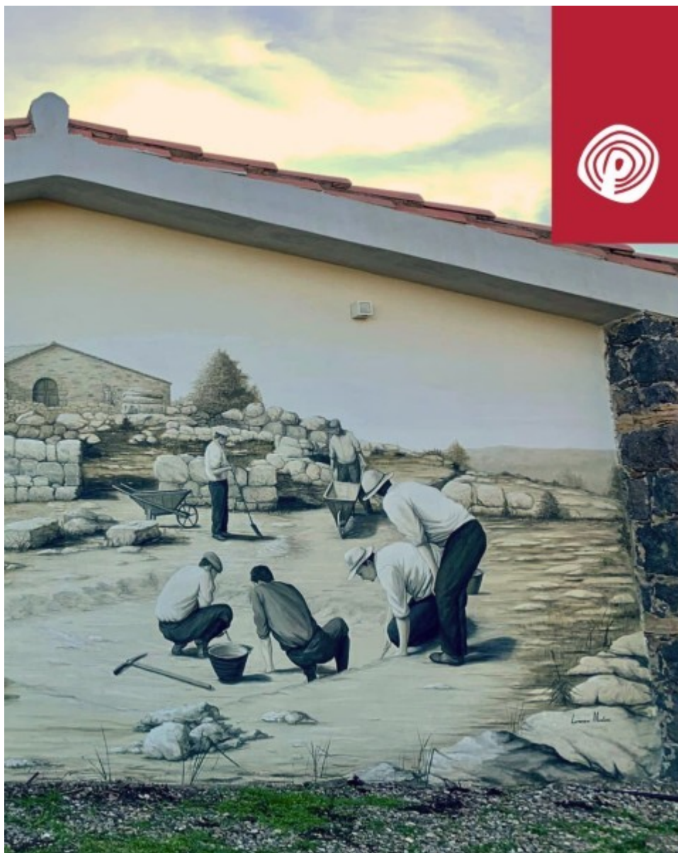
Omaggio a Taramelli, opera murale del maestro Lorenzo Muntoni Artista.

Prototipo nuragico delle Cumbessias , il recinto delle feste era lo spazio deputato ad accogliere i pellegrini che si recavano nel santuario. Il recinto, a pianta ellittica (73×50 metri), si incentra sull'ampia corte centrale dove si affacciano vani porticati e ambienti circolari. Gli accessi al recinto sono due: uno a sud-ovest, l'altro a sud-est. Lo spazio porticato, coperto da un tetto ad un unico spiovente, offriva ai pellegrini convenuti al santuario un riparo in cui pernottare e consumare i pasti, forse preparati nella cucina comune. Qui si tenevano sagre commerciali che duravano diverse settimane. Era un piazzale che raccoglieva tutti i pellegrini che venivano da tutta la Sardegna con capi di bestiame e merci e barattavano, quindi c'era lo scambio commerciale. Il secondo portico è costituito da celle dove probabilmente venivano esposti gli animali durante le sagre commerciali. Non c'era la vendita diretta, ma lo scambio commerciale.