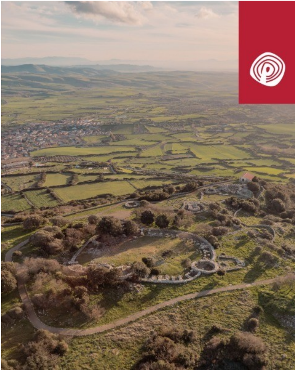
Vista sulla Giara di Serri dal Santuario nuragico di Santa Vittoria.

Ha parlato di destinazione sacra del luogo. Quali divinità si veneravano? Quali caratteristiche presenta il monumento in cui si svolgeva il culto?