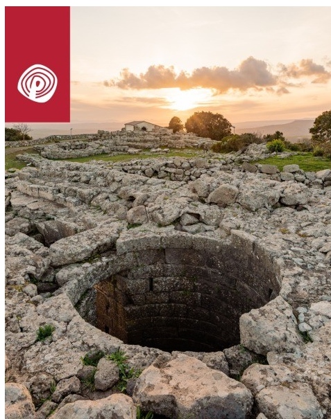
Serri, Santuario nuragico di Santa Vittoria. Tempio a pozzo dedicato al culto delle acque nuragica