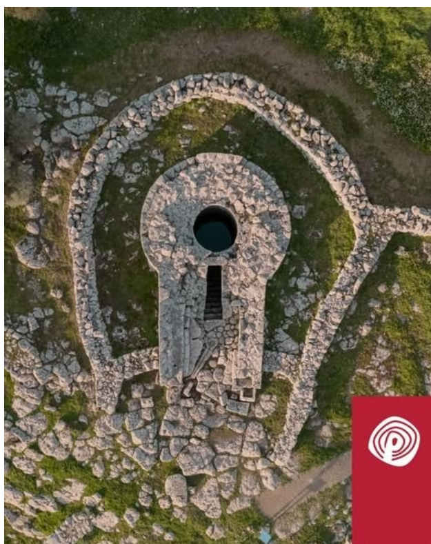
Serri, Santuario nuragico di Santa Vittoria. Tempio a pozzo dedicato al culto delle acque.

Il Santuario Nuragico di Santa Vittoria è sotto la direzione della Fondazione Petrass , che si occupa anche della valorizzazione del sito di Pranu Muttedu, a Goni (SU), ora Patrimonio UNESCO, e del Nuraghe Arrubiu di Orroli (SU).