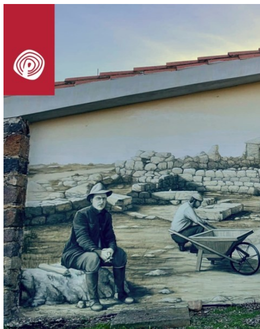
Omaggio a Taramelli, opera murale del maestro Lorenzo Muntoni Artista.

Ci sono due aree di altari: a sinistra l'area di altari minori, dove avvenivano sacrifici animali di piccola taglia, mentre l'altare maggiore, che aveva un ruolo più importante, presentava un cortiletto esterno pavimentato affacciato sull'altare. Nella parte principale sono state ritrovate scolpite delle coppelle che dovevano contenere l'acqua sacra. All'interno di queste coppelle sono stati rinvenuti alcuni bronzi, quindi possiamo intuire che il rito si svolgeva all'esterno del pozzo in onore della stessa acqua, piovana e non di falda, contenuta all'interno del pozzo, poi si spostavano per andare a deporre nelle coppelle degli altari centrali alcuni degli oggetti votivi più importanti. I ritrovamenti hanno fatto pensare che fosse un luogo unito al vestibolo del tempio a pozzo.