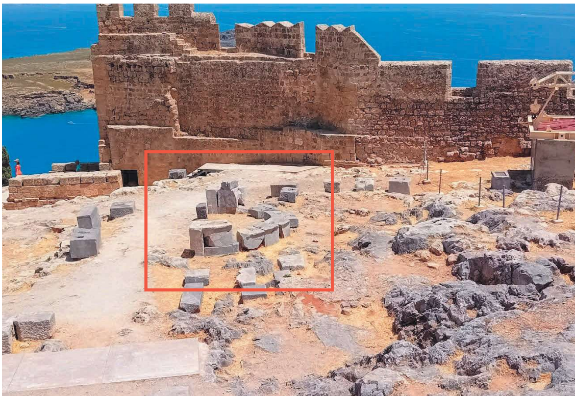
Fig. 2. Monumento con pianta a forma di arco sito a Est del tempio romano nella terrazza inferiore.

e la celebre esedra fatta scalfire da Tiberio tra il 17 e il 19 d.C., in cui l'imperatore si fa definire Evergete (n. 7). Sulla pianta ne sono state aggiunte altre due non contrassegnate da un numero, le quali, pur essendo meno note, sono comunque perfettamente visibili ai fruitori del sito. Per rendere meno astratta la natura di queste costruzioni, se ne riporta, di seguito, una fotografia: