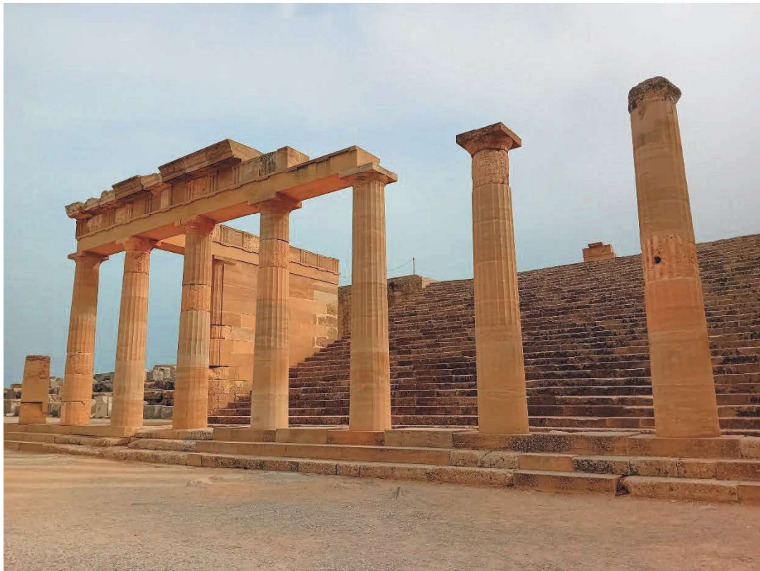
Fig. 3. Resti della facciata della stoà ellenistica come si prospetta oggi. Dietro, la scalinata monumentale di accesso al tempio.

stanze destinate, almeno in parte, a dei banchetti cerimoniali; il terzo è la grande scalinata monumentale (fine V sec. a.C.), costruita sul livello di una più arcaica e che permetteva di raggiungere il tempio passando attraverso i Propilei; l'ultimo è la grande stoà ellenistica (III sec. a.C.) che attraversava l'altopiano dell'acropoli in direzione Sud-Est / Nord-Ovest (lunghezza 88,6 m × larghezza 8,9 m × altezza 6,9 m), articolata in due ali desinenti di forma rettangolare, aventi, ciascuna, diciassette colonne di fronte, riunite da una fila di otto colonne che fronteggiavano la scalinata, sormontate da un fregio e da una cornice da entrambe le parti. Come il tempio di Athana, anche la stoà ellenistica era di ordine dorico (per approfondire lo studio dei monumenti, si rimanda, soprattutto, a BLINKENBERG 1931, pp. 1-60, DYGGVE 1960, LIPPOLIS 1989 e LIVADIOTTI, ROCCO 1996, pp. 52-59).