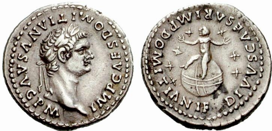
Denarius circa 88-96, IMP CAES DOMITIANVS AVG P M Laureate head r. Rev. DIVVS CAESAR IMP DOMITIANI F. Domitian's infant son shown as a young Jupiter seated on a globe with his hands raised toward seven stars that represent the constellation of the Great Bear.

Concludiamo con una moneta col globo quadripartito. Questo tipo di iconografia verrà ripresa in quella del globo crucigero.