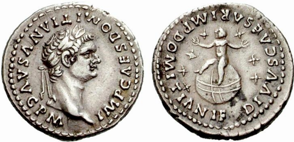
Denarius circa 88-96, IMP CAES DOMITIANVS AVG P M Laureate head r. Rev. DIVVS CAESAR IMP DOMITIANI F. Domitian's infant son shown as a young Jupiter seated on a globe with his hands raised toward seven stars that represent the constellation of the Great Bear.

Concludiamo con una moneta col globo quadripartito anche essa mostrata nel Rif.3. Questo tipo di iconografia verrà ripresa in quella del globo crucigero.