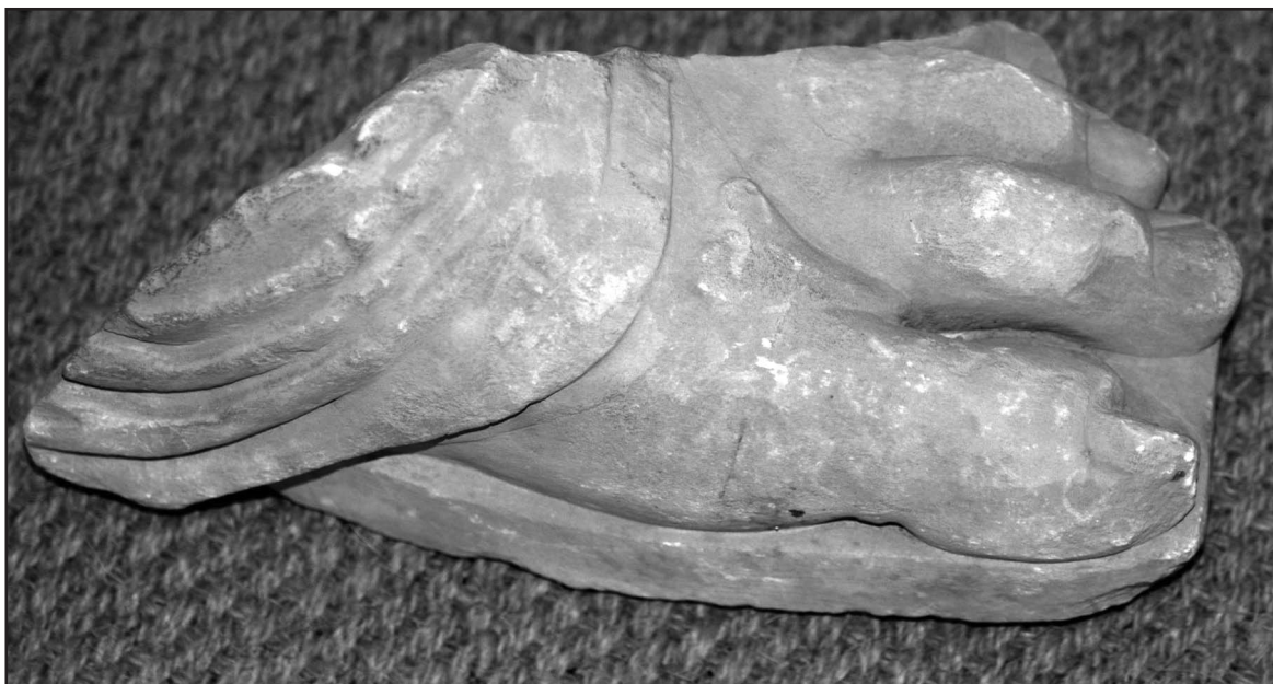
Fig. 2 a, b. Scultura Iside, piede sinistro (detto B)