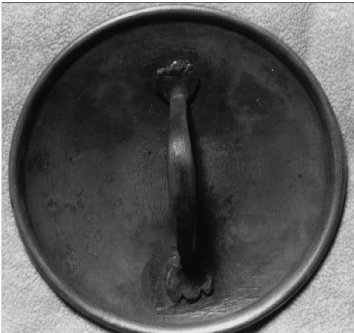
Fig. 5. Specchio d'argento