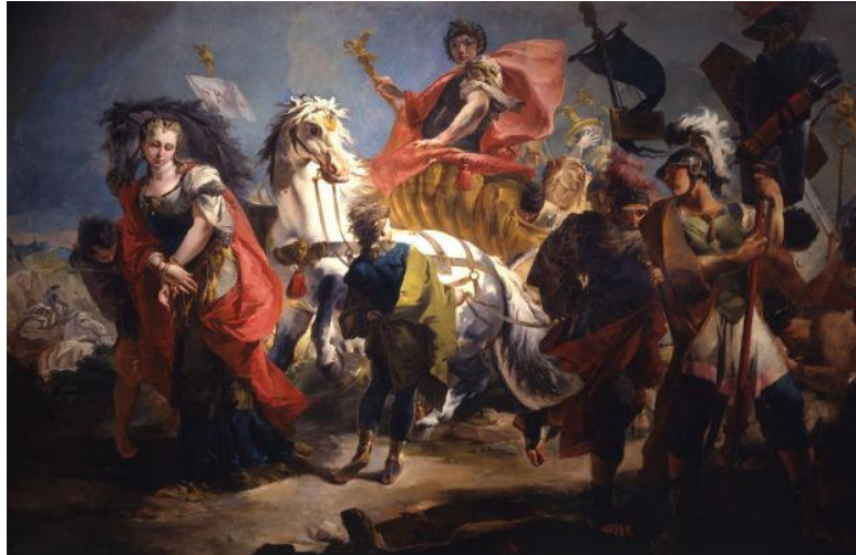
Fig. 8 G.B. Tiepolo, Il trionfo di Aureliano .

In conclusione, l'iconografia dei ritratti femminili a Palmira ha per lungo tempo indotto gli studiosi a ritenere il ruolo come marginale, confinato agli ambienti domestici: uno studio più approfondito degli stessi, ma soprattutto dei testi, hanno mostrato come esse potessero disporre autonomamente dei beni propri o familiari, agendo anche per il marito o i figli, ricevere o dedicare iscrizioni onorifiche o ex voto alle divinità e molto probabilmente assumere in alcuni casi un abbigliamento e un ruolo maschile.