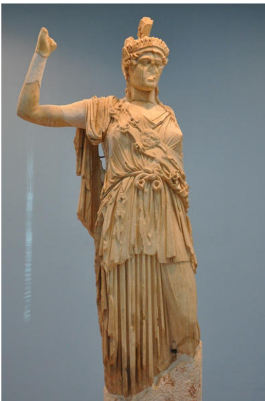
Fig. 1 Allat come Atena

Le Tychai, ovvero le "Fortune" potevano essere quelle legate alla città, come è tipico del mondo ellenistico, o a una famiglia o ancora a entità di vario tipo, come "la Tyche dell'Olivo" (fig. 2) o "della Fonte Benedetta"; compaiono spesso su iscrizioni votive o tessere per banchetti, dove solitamente sono raffigurate sedute su un trono e con una corona turrita sul capo, secondo l'iconografia tipica di tutto il mondo ellenistico; un'immagine della Tyche di Palmira è visibile anche nel Tempio degli dei palmireni a Dura Europos 8 .