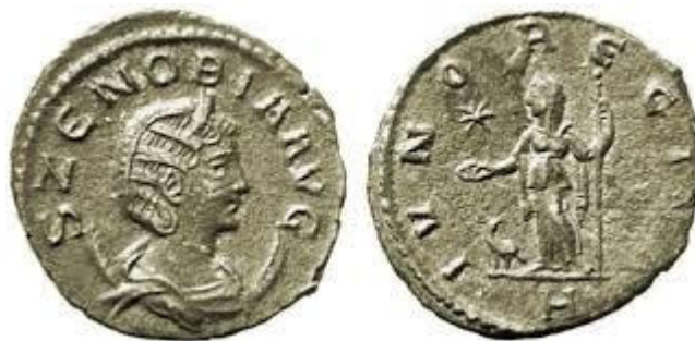
Fig. 7 Moneta coniata da Zenobia.

Dal 270 Zenobia espanse il suo impero in Asia Minore; quando Aureliano fu proclamato imperatore, Zenobia tentò dapprima la mediazione coniando monete (fig. 7) in cui lei e il figlio comparivano, ma Waballat portava solo il titolo di imperator e dux Romanorum , e dove Aureliano è chiamato Cesare e Augusto.