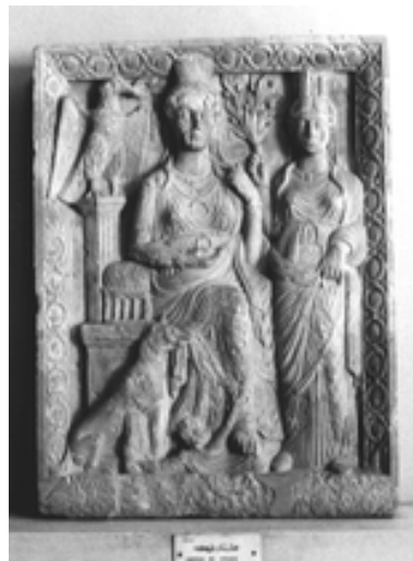
Fig. 2 Le Tychai di Palmira e dell'olivo.