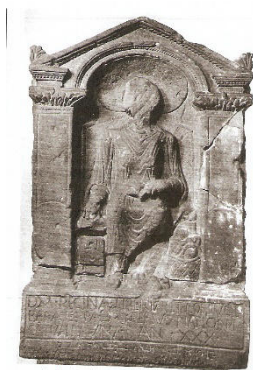
Fig. 3 Stele di Regina

Gandhara abbiano cercato rifugio contro le incursioni sasanidi, portando con sé anche le loro merci 29 .