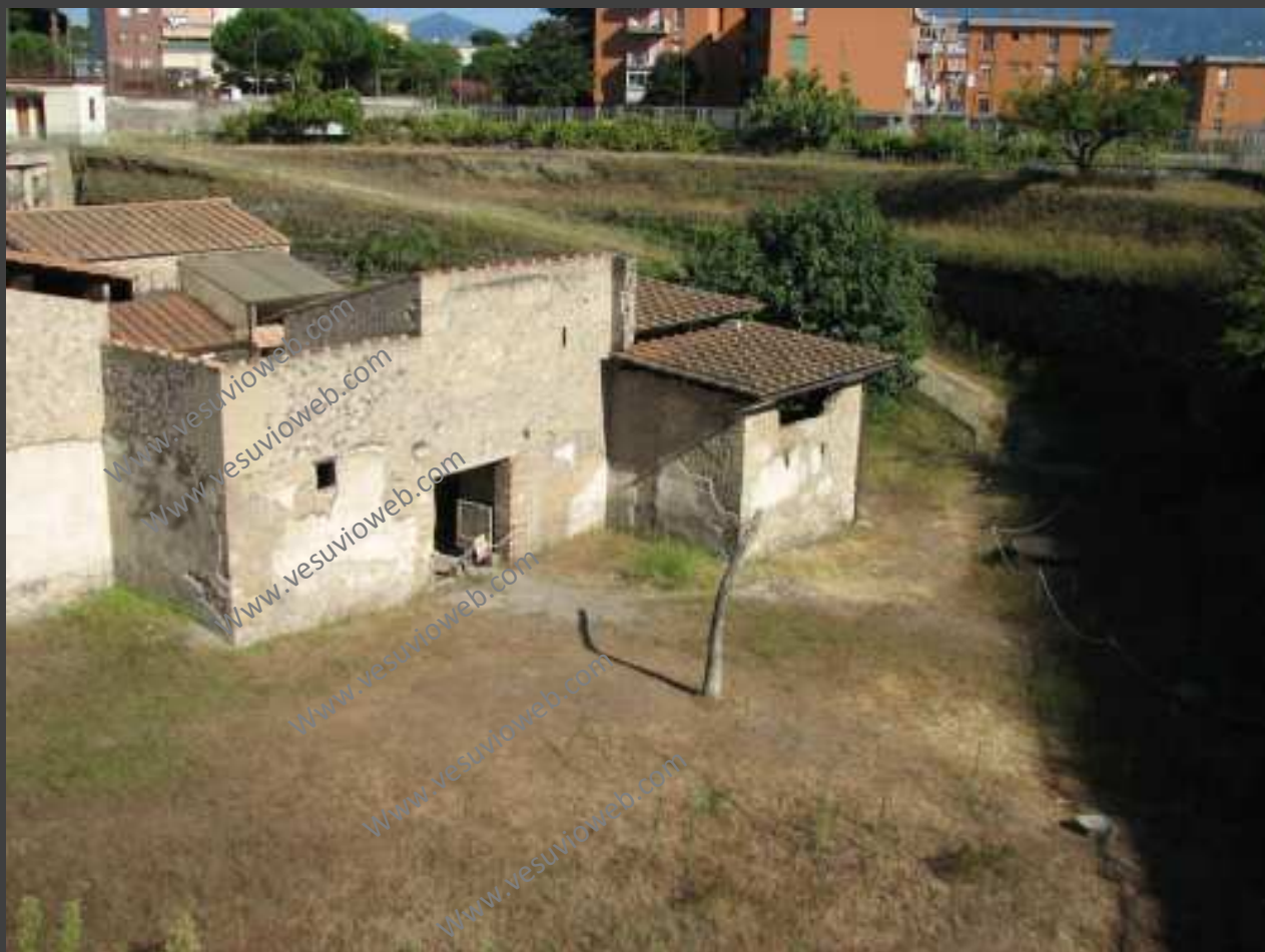
L'ingresso principale della Villa. Una porta ampia per consentire il passaggio del grande carro da lavoro. Se ne leggono ancora i segni del passaggio, incisi sulla pietra del limen.