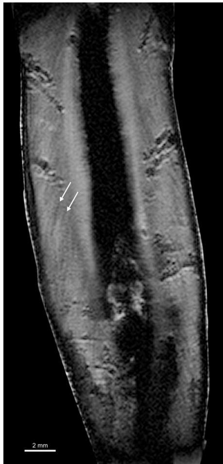
Figura 6 - Sezione virtuale ottenuta attraverso la micro risonanza magnetica della radice dell'incisivo permanente UA 369. Le frecce indicano due linee di Andresen, micro marcatori periodici dello sviluppo della dentina