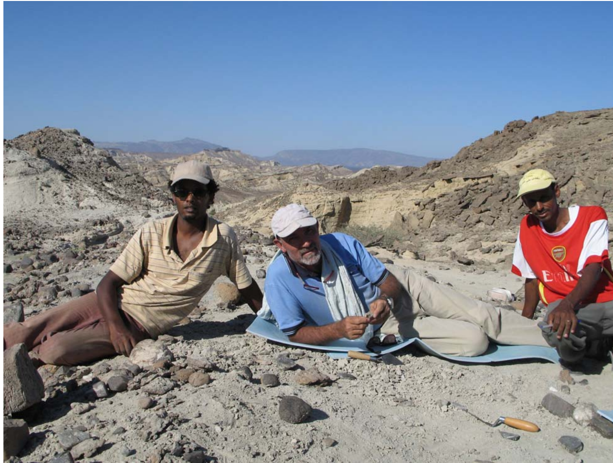
Figura 2 - Il momento del ritrovamento della porzione di parietale destro all'altezza dell'asterion (a sinistra) MA 378 di Homo scoperto durante la missione di campo del marzo 2014 nel sito di Mulhuli-Amo nella Dancalia Eritrea e pianta del sito con i ritrovamenti degli ultimi 5 anni di campagne di scavo (a destra)