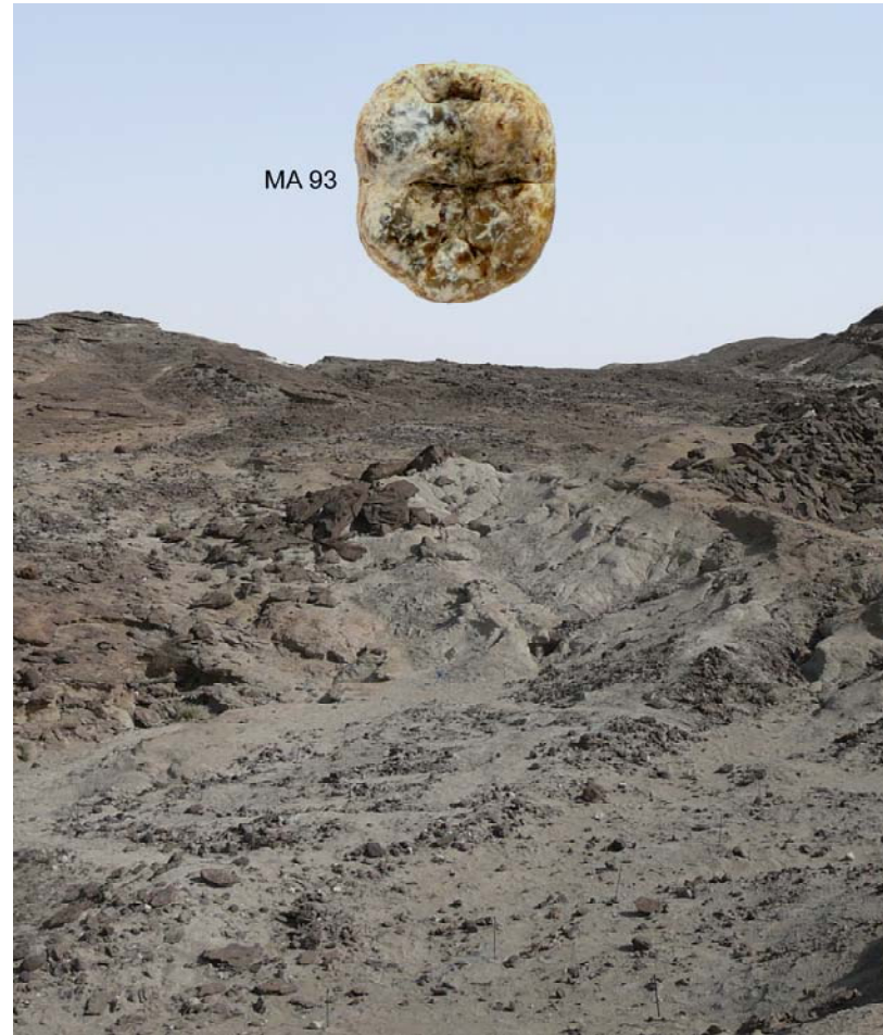
Figura 4 - Il sito Mulhuli-Amo, dove è stato trovato il MA molare 93