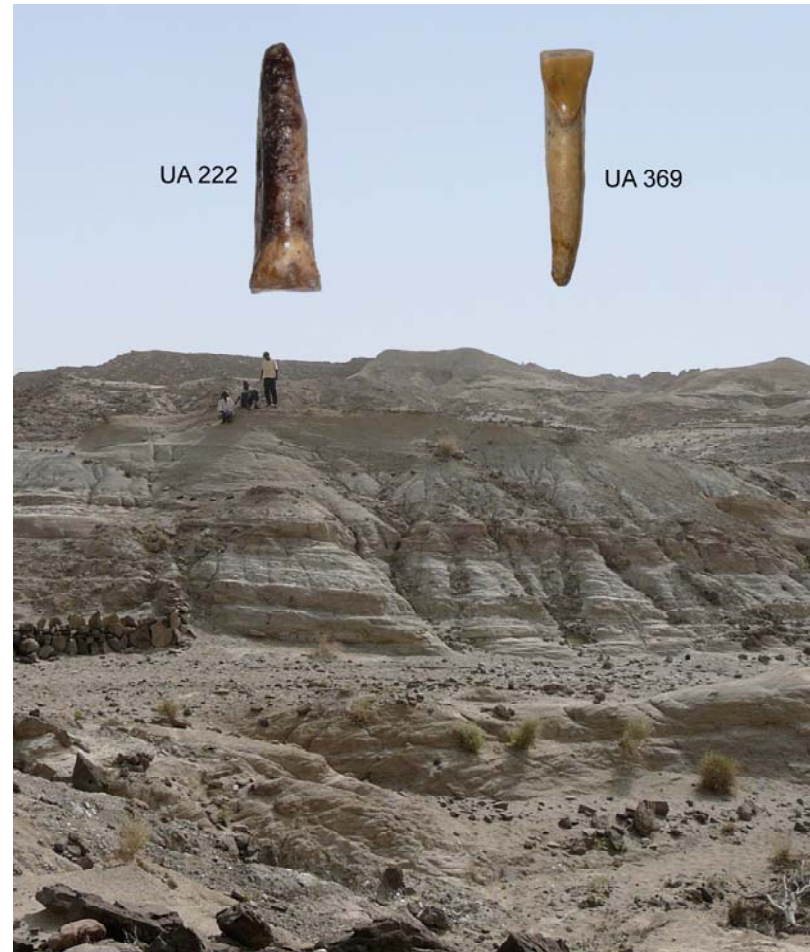
Figura 3 - Il sito Homo di Buia, dove sono stati trovati i due incisivi UA 222 e UA 369