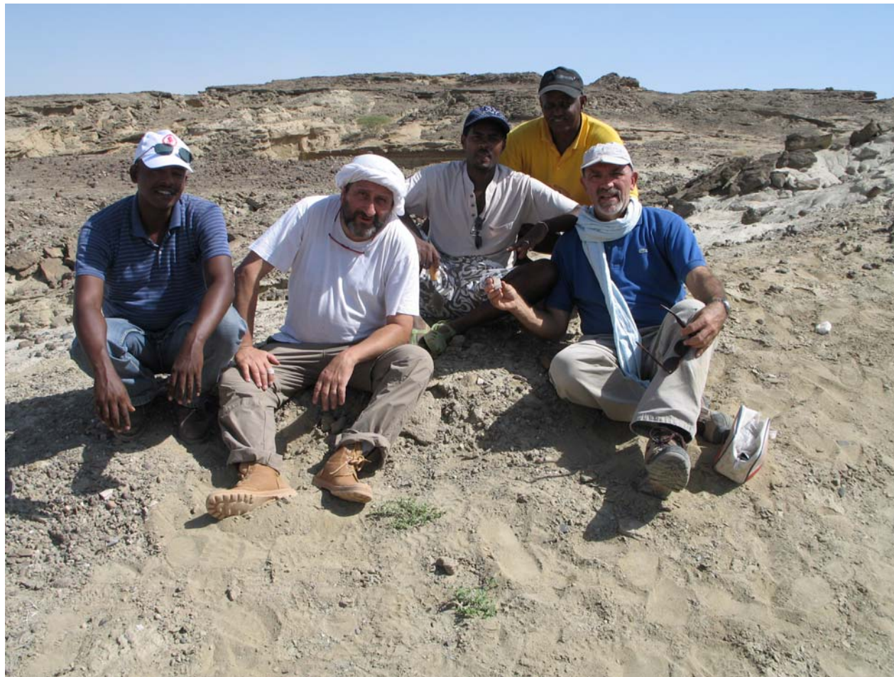
Figura 1 - I momenti del ritrovamento della porzione di parietale (a sinistra) MA 375 e della grande ala sinistra dello sfenoide (a destra) MA 376 di Homo scoperto durante la missione di campo del Dicembre 2013 nel sito di Mulhuli-Amo nella Dancalia Eritrea