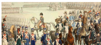
Museo del Risorgimento