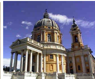
Basilica di Superga