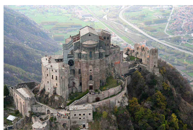
La Sacra di San Michele in Valle di Susa