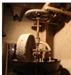
Macina di un antico mulino nel vercellese