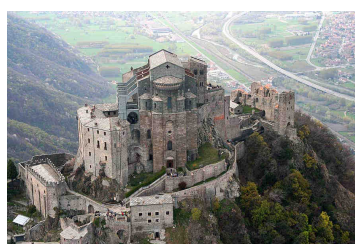
Sacra di San Michele