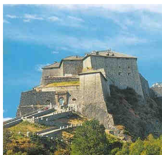
Forte di Exilles