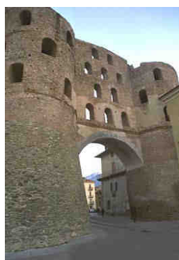
Porta Savoia a Susa