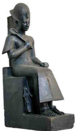
Statua di Ramesse II al Museo Egizio