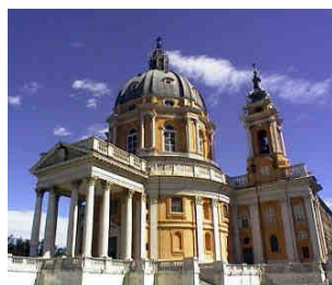
Basilica di Superga