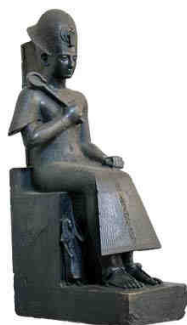
Statua di Ramesse II al Museo Egizio