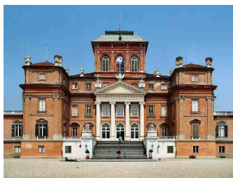
Castello Reale di Racconigi