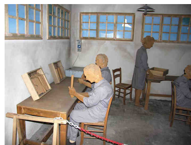
Dinamitificio Nobel di Avigliana