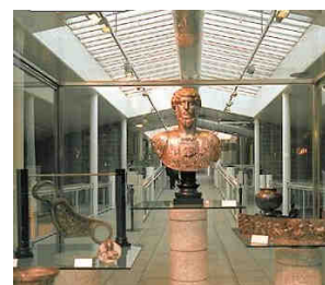
Museo di Antichità