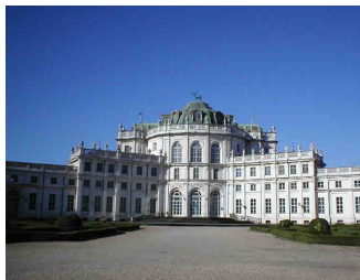
Palazzina di Caccia di Stupinigi