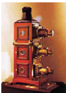
Lanterna magica al Museo del Cinema